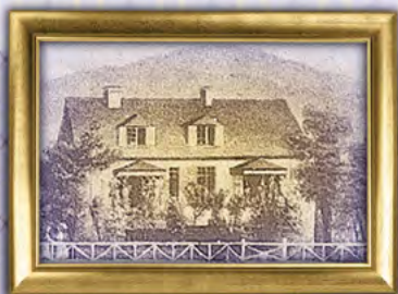
Clara Schumanns Wohnhaus im Baden-Baden