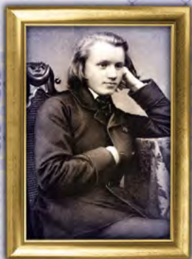
Johannes Brahms 1853 im Alter von 20 Jahren