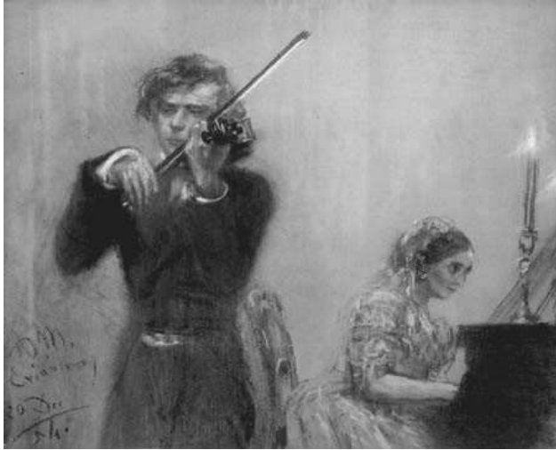
Joseph Joachim und Clara Schumann, Pastell- zeichnung von Adolph Friedrich v. Menzel, 1854