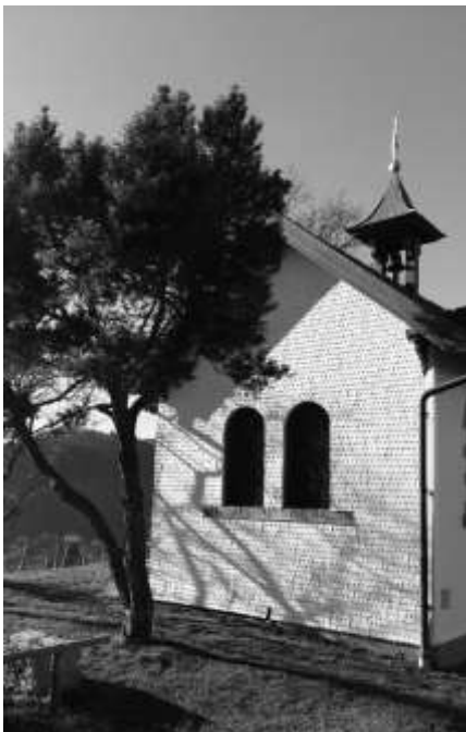
die Marienkapelle auf dem Eckberg gleich oberhalb des Brahms-Hauses in Baden-Baden/Lichtental; hier sollen Brahms bei einem seiner vielen Spaziergänge die musikalischen Ideen zum Horntrio gekommen sein..