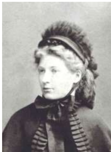
Elisabeth v. Herzogenberg

Elisabeth von Herzogenberg (1847-1892) war die Tochter Bodo Albrechts von Stockhausens, des Hannoverschen Gesandten am Wiener Hof, und wurde - nach einigen Unterrichtsstunden bei Johannes Brahms- von dem berühmten Wiener Pianisten Julius Epstein ausgebildet. Für den eigenen Gebrauch komponierte sie Lieder und Klavierstücke, von denen nur die 24 Volkskinderlieder und die Acht Klavierstücke überliefert sind. Von Kindheit an herzleidend starb sie im Alter von nur 44 Jahren an Herzschwäche. Heinrich v. Herzogenberg wollte durch die Herausgabe der Acht Klavierstücke nach eigenen Worten „wie ein Phonograph ihre Musikseele fassen und festhalten“ und setzte selbst die ausführlichen Widmungen wie Überschriften über die einzelnen Stücke.