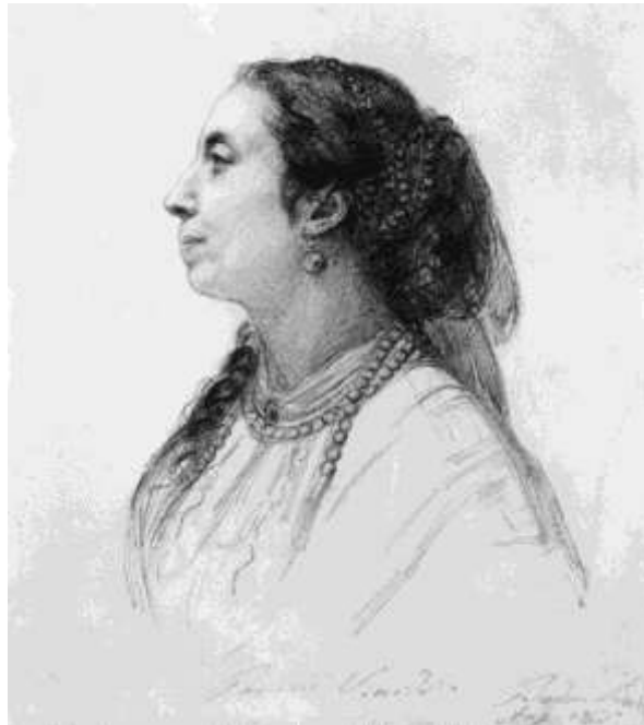
Pauline Viardot, Zeichnung Ludwig Pietsch, Baden-Baden, 1865

Pauline Viardot (*18. Juli 1821 in Paris, † 18. Mai 1910 ebd.) war eine der berühmtesten Sängerinnen des 19. Jahrhunderts. Sie war darüberhinaus eine begabte und tätige Pianistin, Pädagogin, Komponistin und Musikschriftstellerin und hatte brieflichen und persönlichen Kontakt zu vielen kulturell prägenden Intellektuellen und KünstlerInnen des 19. Jahrhunderts, darunter Franz Liszt, Charles Gounod, Robert und Clara Schumann, Felix Mendelssohn, Theodor Storm, Gabriel Fauré, Iwan Turgenjev, Camille Saint-Saëns, George Sand u. v. a.