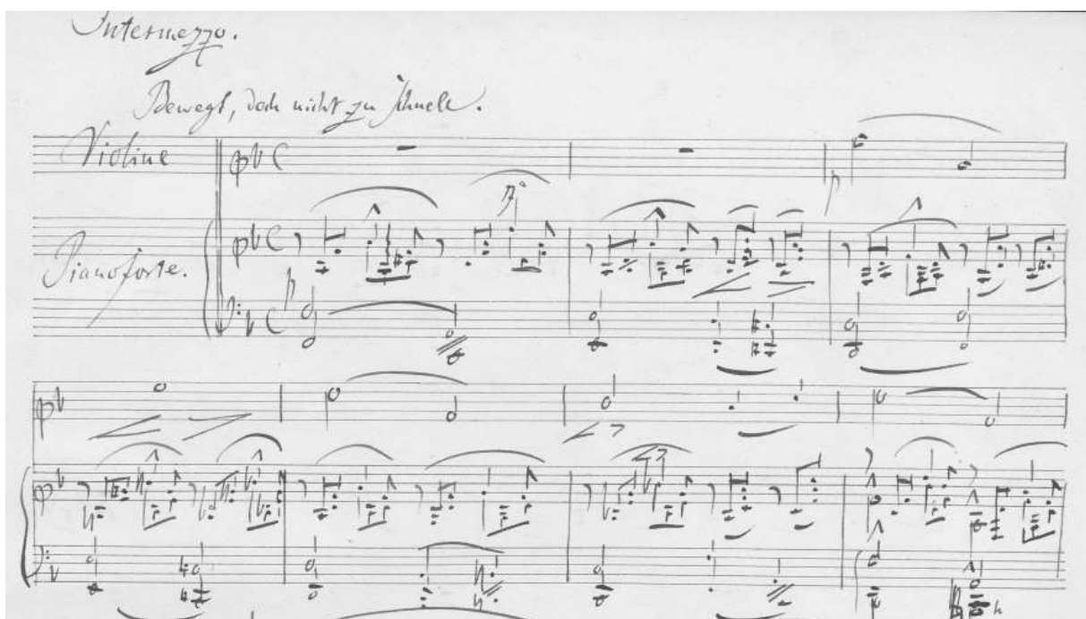
Autograph der FAE Sonate. Intermezzo (2. Satz) von Robert Schumann