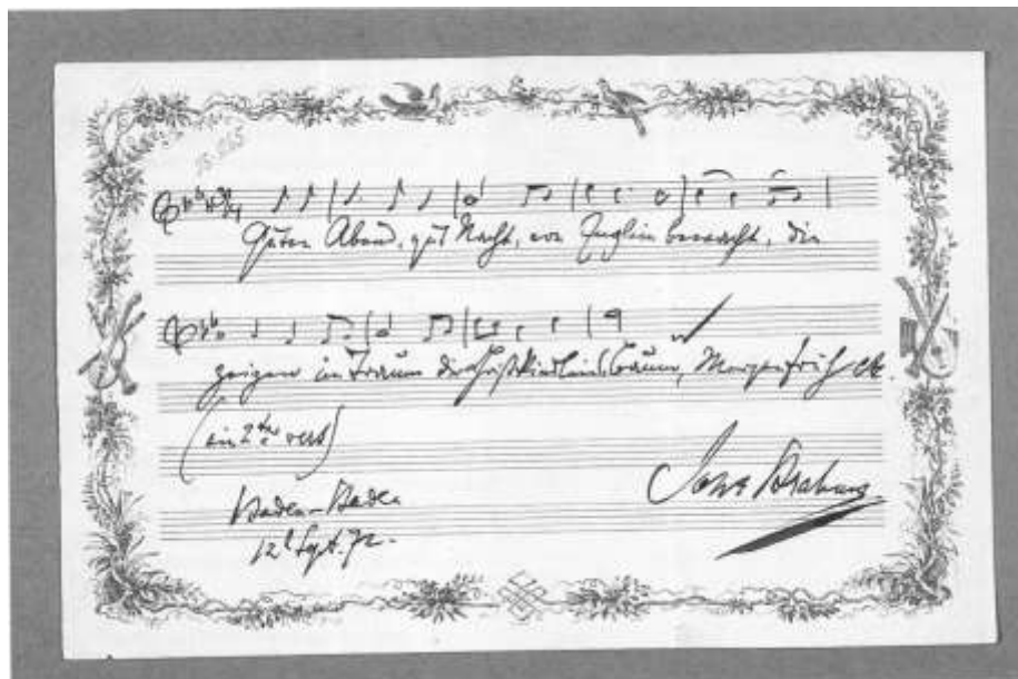
Widmungsblatt für Clara Schumann mit dem Wiegenlied Baden-Baden 1872

Der Weinbrennersaal in Baden-Baden (erbaut 1821-25), wo Brahms oftmals konzertierte. 1872 dirigierte er seine Haydn-Variationen in einem Benefizkonzert für das städtische Orchester. Hier fand im September 1887 auch die von Clara Schumann organisierte erste Aufführung des Doppelkonzertes op. 102 vor geladenen Gästen statt.