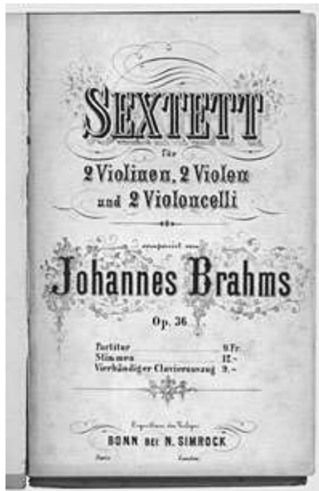
Titelblatt der Erstaussgabe