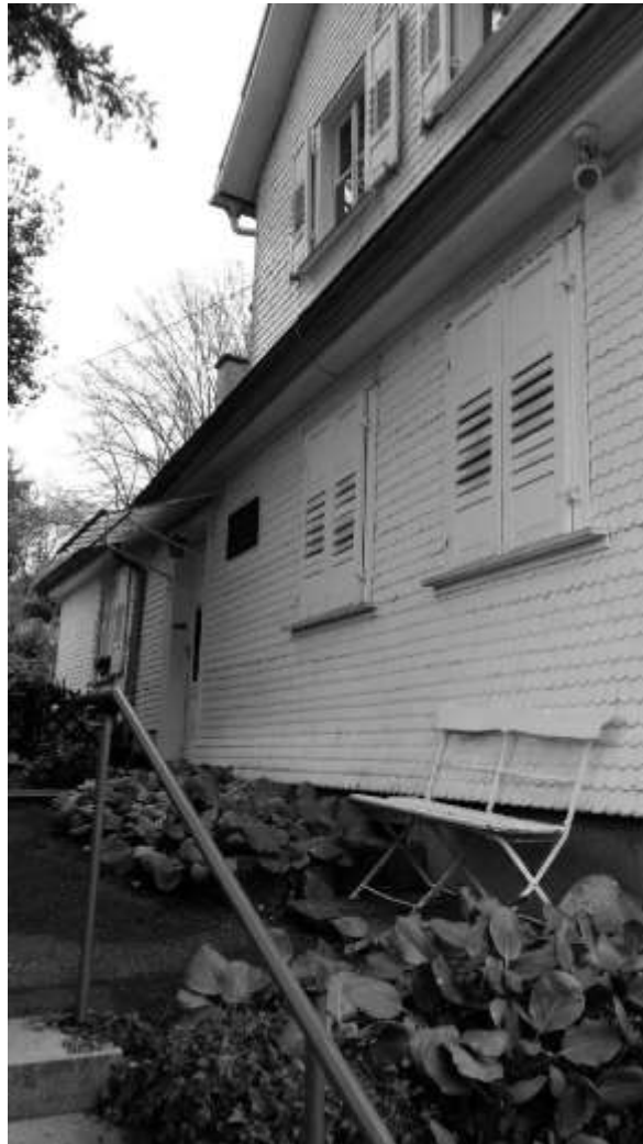
Baden-Baden/ Lichtental, Brahmshaus