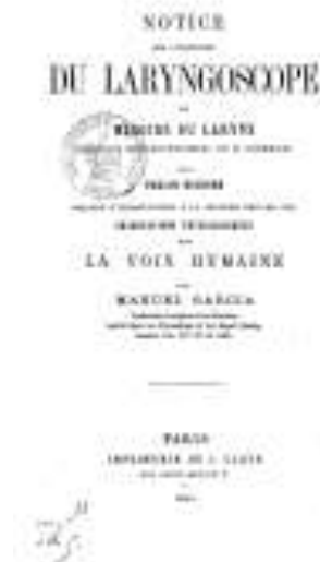
Erstausgabe seiner Arbeit über den Kehlkopfspiegel

Manuel Garcia fils (1805-1906), der um 16 Jahre ältere Bruder von Pauline war einer der bedeutendsten Gesangspädagogen des 19. Jahrhunderts. Er gab zahlreiche gesangstheoretische Schriften heraus und beschäftigte sich mit der Anatomie des Kehlkopfes. 1855 erfand er das Laryngoskop, den Kehlkopfspiegel. Er lehrte am Pariser Conservatoire und an der Royal Society in London. Zu seinen bedeutendsten SchülerInnen zählten Julius Stockhausen, Mathilde Marchesi und Jenny Lind.