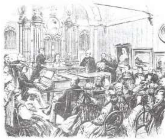
Eine Matinee in der Orgelhalle der Villa Viardot in Baden-Baden 1865.

Oben: Pauline Viardot, Iwan Turgenjew, Louis Viardot, Manuel Garcia (Sohn), König Wilhelm I. und die Königin von Preussen, Gustav Doré, Anton Rubinstein, Otto v. Bismarck und Theodor Storm.