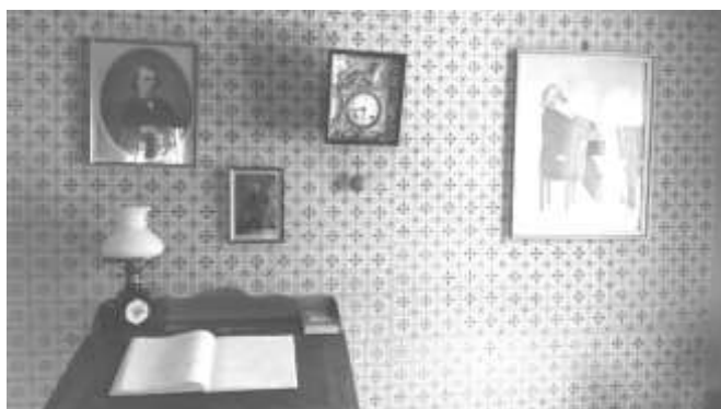
Brahms-Haus Baden-Baden/Lichtental im Arbeitszimmer des Komponisten