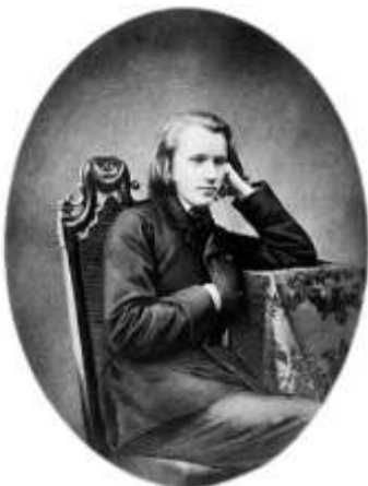
Johannes Brahms 1853 - im Alter von 20 Jahren