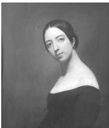
Pauline Viardot-Garcia, 1840