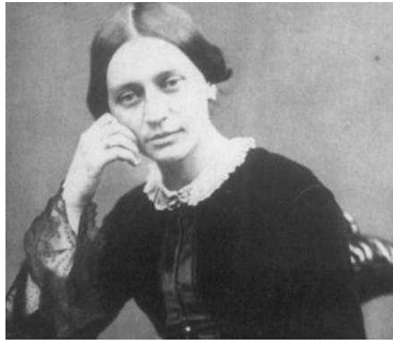
Clara Schumann (um 1853)

Die „Gesänge der Frühe“ bedeuteten Schumann so viel, dass er sich noch in der Heil- und Pflegeanstalt Eendenich mit ihnen befasste. Von dort aus bat er Clara, ihm zur Ansicht noch einmal das Manuskript zukommen zu lassen. Der Widmungsträgerin Bettina von Arnim schrieb er, es würde ihn freuen, wenn sie die Stücke in Claras Interpretation hören könnte.