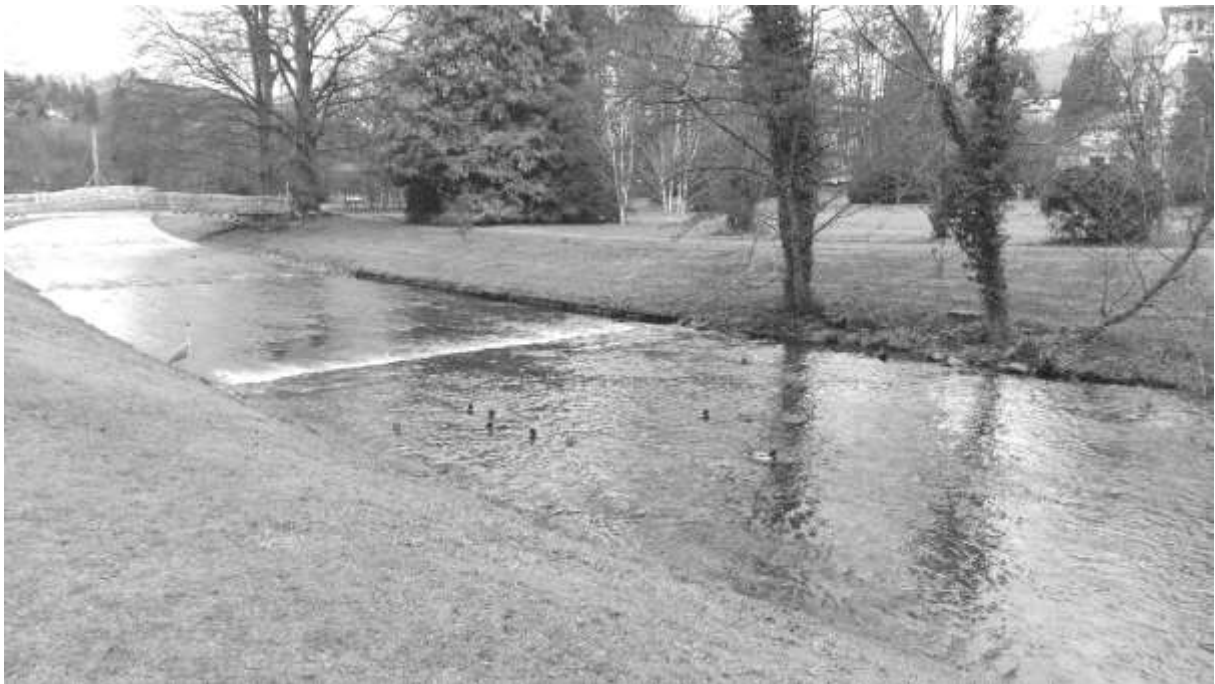
Baden-Baden, an der Oos