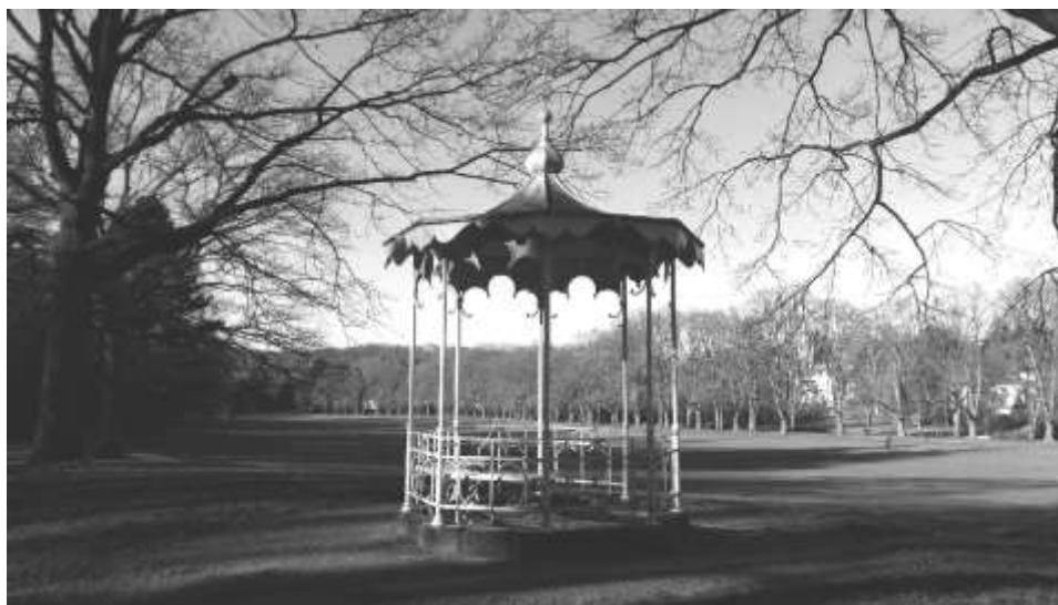
Baden-Baden, Pavillon nabe der Lichtentaler Allee

Brahms begann sein kammermusikalisches Schaffen wie viele Komponisten mit Streichquartetten, doch hat er diese frühen Werke später vernichtet. Die ersten Stücke reiner Streicher-Kammermusik, die er veröffentlichte, waren seine beiden Streichsextette, op. 18 und 36. Obwohl die Verleger anfangs skeptisch waren, ob sich Werke dieser seltenen, von Luigi Boccherini erst um 1777 begründeten Gattung verkaufen würden, wurden die Sextette rasch zu einem großen Erfolg.