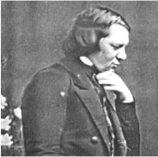
Robert Schumann (Daguerrotypie um 1850)