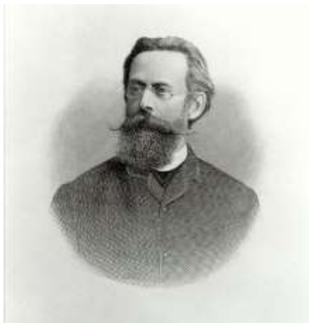
Heinrich v. Herzogenberg

Die ersten Kammermusiken, mit denen der junge Brahms den Anspruch der „Neuen Bahnen“ einlöste, waren sein H-Dur-Klaviertrio in der Urfassung und drei Klavierquartette, die er 1855, im Alter von 22 Jahren, begann. Die ersten beiden in g und A vollendete er 1861, das dritte in cis erst 1875, um es schließlich doch noch – in einer revidierten Fassung in c – zu veröffentlichen. Auch für die beiden anderen ist von solchen grundlegenden Abweichungen zwischen den Frühfassungen und den heute bekannten gedruckten Versionen auszugehen. Der überkritische Brahms räumte offenbar, belehrt durch die Erfahrungen mit dem ersten Klaviertrio, den Klavierquartetten eine längere Reife- und Erprobungszeit ein, wie die Aufführungsgeschichte des A-Dur - Quartetts beweist. Während das Schwesterwerk Opus 25 bereits unmittelbar nach der Vollendung zur Uraufführung gelangte, ließ er sein Opus 26 noch ein weiteres Jahr liegen, bevor er im November 1862 an die Vorbereitung der Wiener Premiere ging. Im Zuge der Proben mit dem Hellmesberger- Quartett tauschte er ganze Passagen im Streichersatz aus, veränderte Lagen und Stimmführungen, ja sogar Motive. So hat er etwa für den Beginn des Adagios erst in den Proben die perfekte Balance gefunden. Die Fülle der Änderungen läßt sich noch heute am Autograph der Partitur ablesen, das zum Nachlaß des Pianisten Rudolf Serkin gehört.